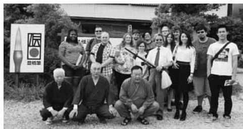
豊橋市内施設も見学するトリード大学生訪問団(昨年度の様子)

また、今後もさらなるトリード市との友好親善の輪を広げるため、トリード大学の大学教授と大学院生によるトリード大学を紹介する講座を開催し、トリード姉妹都市奨学金制度の説明など、青少年への積極的な利用を推進するため、各種情報を提供します。