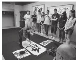
迫力ある書道のパフォーマンスを目の前で体験