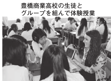
豊橋商業高校の生徒とグループを組んで体験授業