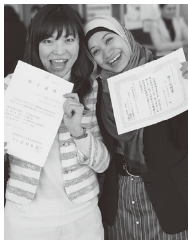
介護職員初任者研修課程修了証明書 を手に専門学校の先生と

また現在は、日本赤十字社愛知県支部から講習の際に赤十字社の指導員のサポートができる「赤