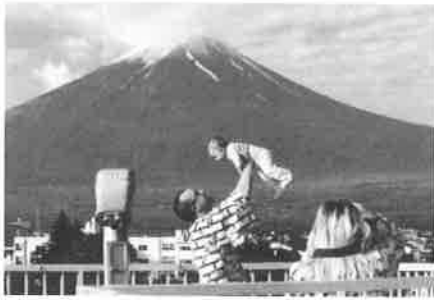
優秀賞受賞作品より

平和・交流・共生のまち とよはしインターナショナルフェスティバル2016（11月20日こども未来館にて開催）のイベントの一つとして実施する「国際交流フォトコンテスト」の写真を集めます。