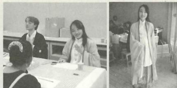
「とよはしインターナショナルフェスティバル」にて