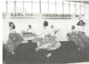
ブラジルダンス「カリンボー」