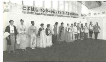
民族衣装ファッションショー