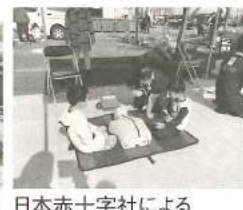
日本赤十字社によるAED体験