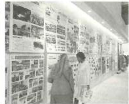
国際交流団体の活動紹介