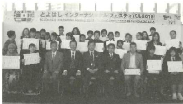
協賛：豊橋みなとライオンズクラブ

まだまだ好きな日本語がおびただしい数ありますが、今日はここで終らせて頂きます。皆さん、ご清聴ありがとうございました。