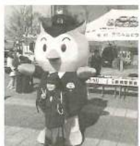
豊橋警察署コノハ警部