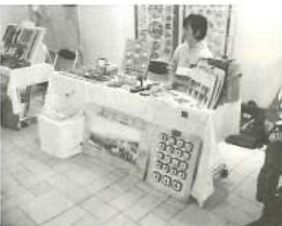
フェアトレードバザー