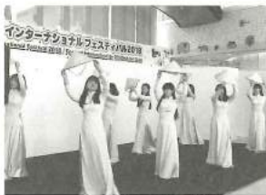
ベトナム民族舞踊