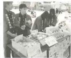
豊橋商業高校「オリジナルスイーツ」