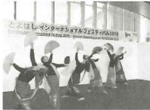
フィリピン民族舞踊