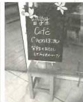
世界文化体験(留学生カフェ)