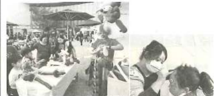
子どもたちに大人気のフェイスペイントとバルーン