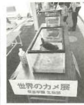
桜丘学園「世界のカメラ展」