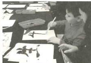
世界文化体験(書道)