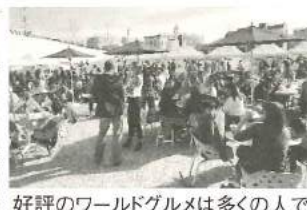
好評のワールドグルメは多くの人でにぎわいました