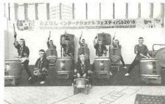
躍動感あふれる豊丘高校和太鼓部