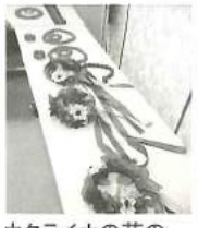
ウクライナの花のカチューシャ