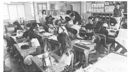
サマースクールの様子