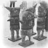
モダンな作品が並ぶアートギャラリー

また、リトアニアが愛知万博フレンドシップ相手国であったことを機会に設立された市民団体「リトアニア友の会豊橋」が継続した交流活動を重ねていることに加え、10月には、豊橋市中学生海外派遣事業で、初めて中学生をパネヴェジス市での青少年交流を中心としたリトアニアへ派遣するなど、オリンピック・パラリンピックとあわせ今後も両市の市民を中心とした交流推進が期待されます。