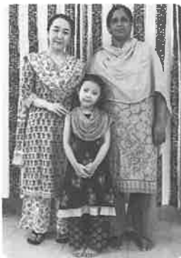
サラワ・カミーズを着て