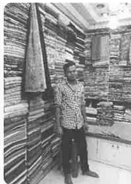
店の天井まで積まれた色とりどりの生地

輸出用の洋服を毎日せっせと縫う女性たちは、自分たちではそうした既製品の洋服を着ることはほとんどありません。男性たちは普段からTシャツやジーンズなどの洋服を着ますが、女性はサラワ・カミーズという伝統的な衣装を身につけています。ゆったりとした薄手のズボンに丈の長い上着を着て、大ぶりのスカーフをまといま す。とても色鮮やかな衣装で、女性たちが通りを歩くと街全体が明るくなるような気さえます。サラワ・カミーズは、布屋に積み上げられた無数の生地の中から好みの布を選び、テイラーに自分ぴったりのサイズに作ってもらうのが一般的です。私も着ることがありますが、見た目以上に涼しく快適で、着ていると自分がより Bangladesh の空気に馴染んでいるように感じます。