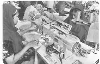
縫製工場働く女性たち

さまざまな問題を抱える縫製産業ですが、地方の貧しい家庭出身の若い女性たちの貴重な就職先でもあります。さもなければ、10代のうちに親の決めた年の離れた男性のところにお嫁に出されていた女の子たちも少なからずいるでしょう。手に職をつけて現金収入を得ることは、彼女たちの人生に選択肢をもたらすはずで