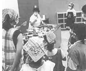
「ヨルダンやペルーなど日本とは生活が違う国が世界にたくさんあるんだね。」

社会/ヨルダンってどんな国? ～幼児教育を通して～ 家庭科/ペルー料理教室 ～カウサレジェーナ、アロス・タパド、ゼリー～ 図工/ピニャータを作ろう 音楽/メキシカンダンスレッスン “このステップを覚えればメキシコに行っても大丈夫”