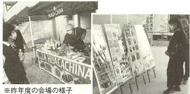
※昨年度の会場の様子