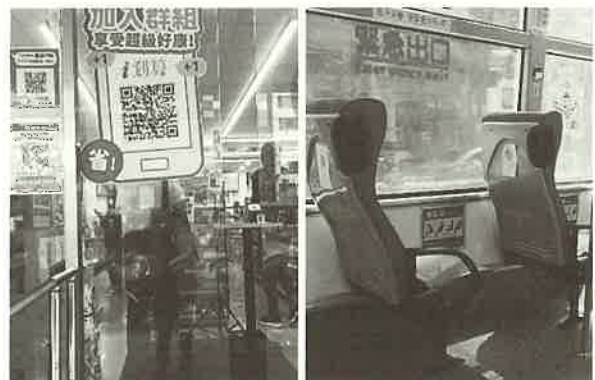
街中いたる所にあふれるQRコード

新型コロナウイルスが早く収束し、今会えない家族や友人と、再び自由に会えるようになることを願っております。