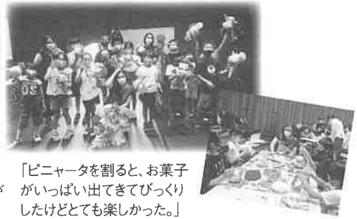
「ピニャータを割ると、お菓子がいっぱい出てきてびっくりしたけどとても楽しかった。」