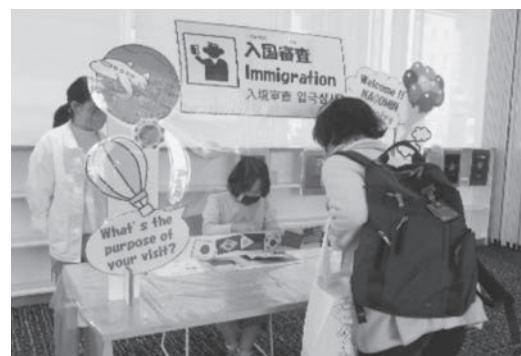
2022年2月11日のイベントの様様

この市に暮らす外国籍の方々が“豊橋市は住みやすい”と感じてもらえるように、今後も豊橋市及び国際交流協会と連携・協力した取組を推進していきたいと思えます。