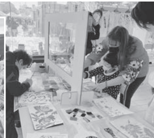
※昨年度の会場の様子