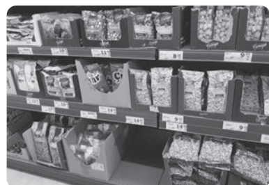
マーケットで売られているひまわりの種

日本では伸びるアイスが有名だが、本来材料は砂糖、ヤギの乳、サーレップの3つ。サーレップというのは蘭の一種で、根っこを粉末にしたものの中匙一杯位で1リットルの乳がまかなえる。そして何となく暇潰し的に手が伸びるのが、ひまわりの種。前歯で割って中身を食べる。適度に塩気があってクセになる、とてもポピュラーな食べ物。