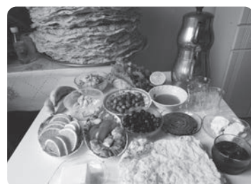
朝御飯一例、手前にあるのが保存用に焼いたユフカ

トルコでは、どこに行っても、どんな時でも当然の様に お茶が振る舞われる。招待されてお茶に行く時、客として訪問する時、何が出されるかがお楽しみ。基本手作りで甘いものと甘くないものが半々で何種類出てくるかは、その時々次第。甘いものなら、ケーキ、クッキー、ブラウニー、強烈に甘いシロップがけのお菓子、牛乳を使った柔らかいお菓子など。甘くないものなら、味付け御飯をピーマンに詰めたり、ブドウの葉で巻いたもの、ひきわり小麦またはレンズ豆を野菜と一緒に味付けて丸めたもの、マカロニのんにくヨーグルトあえ、生地を薄く延ばしたユフカと呼ばれるものの間にチーズとかポテトを重ねオーブンで焼いたボレッキなど。面白いのは、材料の表記がコップ一杯とか、スプーン2杯とか一握りの胡桃などグラム単位ではないこと。適当だけど、ちゃんと出来る。