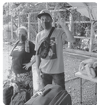
2週間の隔離生活明け

また、新聞やテレビの方々のおかげで私たちの置かれた厳しい状況がクローズアップされ、支援、協力、共感、賛同の輪が広がったことに、この場を借りてお礼申し上げます。