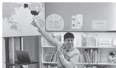
「絵本の読み聞かせ」の様子

やはり仕事は全てですね(冗談です)!でも、この世にいるうちの貴重な仕事以外の時間を大切にすることにも全力を尽くしましょう。どこにいても現在を幸せな未来の懐かしい過去にしたいと思います。