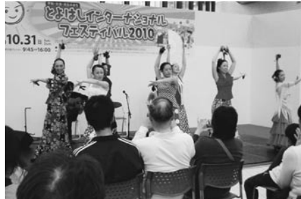
華麗なフィナーレのフラメンコ