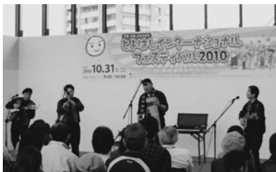
悠久なアンデスの音楽