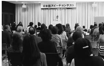
満員御礼「日本語スピーチコンテスト」