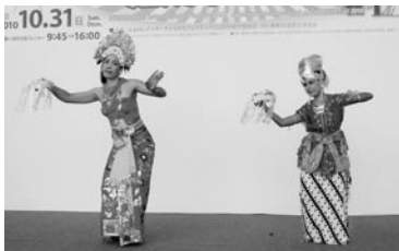
美しいバリ&ジャワの踊り