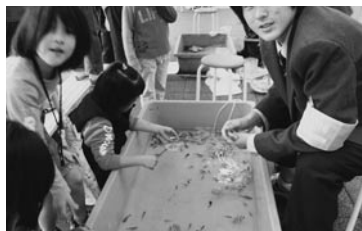
子供に大人気。桜丘学園の金魚すくい