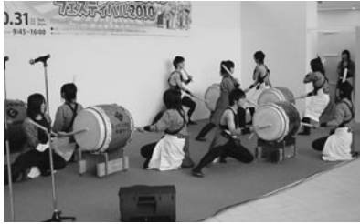
桜丘学園「桜花太鼓」