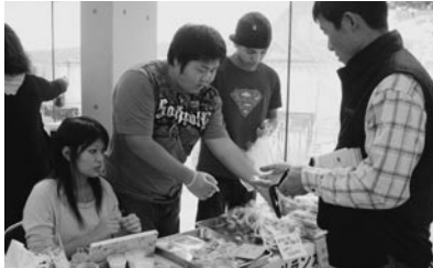
盛況だったワールドグルメ