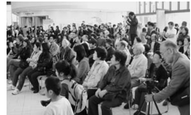
多くの市民の皆様にご来場いただきました。