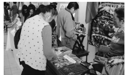
大人気! フェアトレード

昨年10月31日(日)こども未来館ここにこを会場に「とよはし国際フェスティバル2010」を開催しました。 ステージでは、プレショーの桜丘学園、「桜花太鼓」の力強い太鼓演奏で幕を開け、カポエイラ、ブラジルの子供のダンス、アンデスの音楽などが続き、フィナーレはフラメンコで、会場が一体となって盛り上がりました。ワールドグルメやフェアトレードも各国の料理や民芸品が並び例年同様盛況でした。また2階では第12回日本語スピーチコンテストが行われ、こちらも立ち見が出るほど満員の中、外国人市民が語る日ごろの気持ちに耳を傾けました。 当日は、心配された台風の影響もなく、多くのボランティア、国際交流団体の皆様のご協力をいただき、来場者も約4,500人と大盛況のうちに無事終了することができました。ご来場いただいた皆さん、ご協力いただいた皆さん、ありがとうございました。