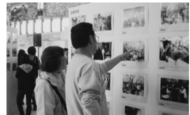
会場を彩った国際交流フォトコンテスト