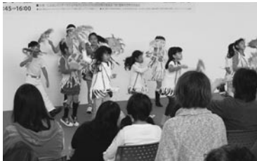
ブラジルの子供のダンス