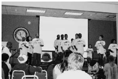
クワンザ地区の子どもたちによるダンスパフォーマンス

秋学期も後半になり、大学の研究や講義で生徒たちもだんだん忙しくなります。今学期中は私自身も、定性的研究の一貫でフィールドワークに大学外で研究・データ集計する機会が何度かありました。今現在取り組んでいるプロジェクトは、トリードのダウンタウン近郊にある治安の最も悪いスラム街であるクワンザ地区の経済の活性化、治安の維持を目指すというものです。市内では別名で最も“ニグレクト”された地域とも言われている中、住民と研究員とが一貫となり対策を講じていくのが狙いです。