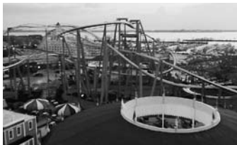
夏休みと10月だけの期間限定ジェットコースター

この季節に、とっておきなものは、なんといっても学校外でのイベントや祝日が多いということです。週末に私が向かった先は、トリードから車で東に約1時間半のセ