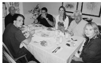
お呼ばれた友人宅ファミリー

11月下旬から12月にかけては感謝祭やクリスマスなど、ホリデーシーズン真っ盛りです。大学も五連休となり学生ともども帰省ラッシュ